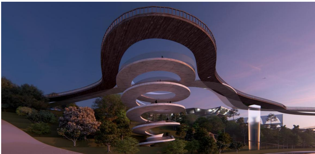
图 3.3 桥梁效果图（作者自绘）

景观梁桥作为连接不同景观区域的重要节点，其设计不仅承载着交通功能，更在文化体验和视觉美学方面发挥着重要作用。在尧头窑文化博物馆及其周边场景设计中，景观梁桥的构建旨在实现其与周围环境的和谐共生，从而增强整体景观的连贯性和文化深度。