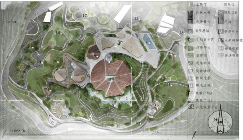
图 3.1 彩平图（作者自绘）

提出“动态保护机制”，将“窑变不可控性”工艺哲学转化为可操作的保护框架，构建工业遗产符号体系，通过碎陶片重组、废弃烟囱改造等实现文化符号现代转译。